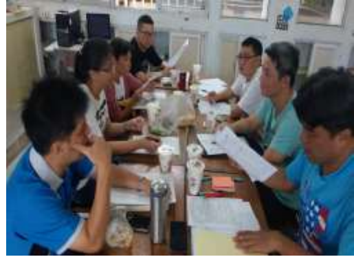
活動照片：數學科 108 課綱認識