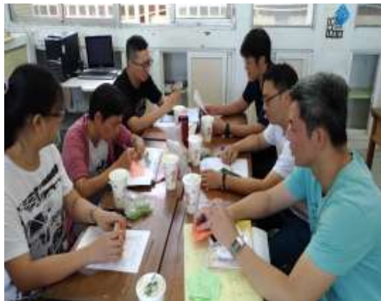
活動照片：校本走向討論