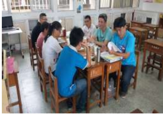
活動照片：數學科 108 課綱認識