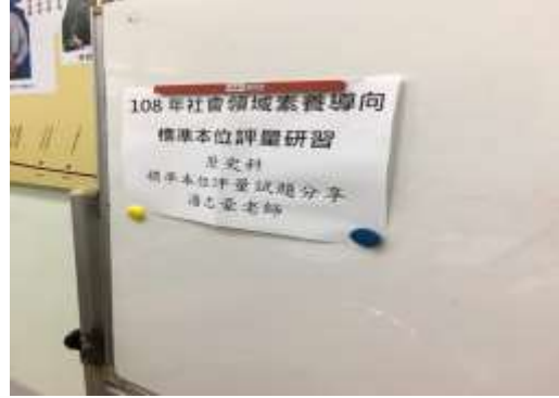
活動照片：歷史標準本位評量試題分享