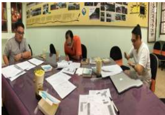
活動照片：歷史標準本位評量試題分享